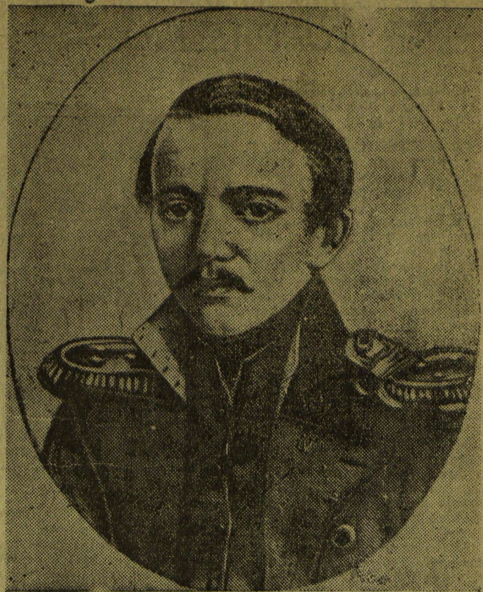
107 лет со дня смерти